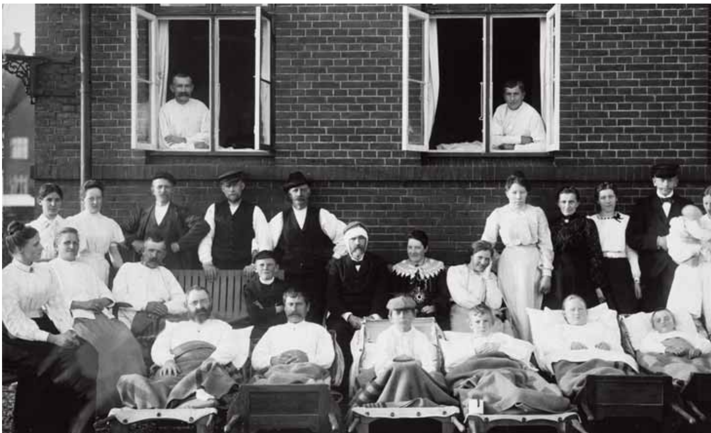
Patienterne på Esbjergs første sygehus på Bavnehøj taget ud til fotografering omkring 1906. Der var ikke flere, end de sammen med personalet kunne være på et fotografi.