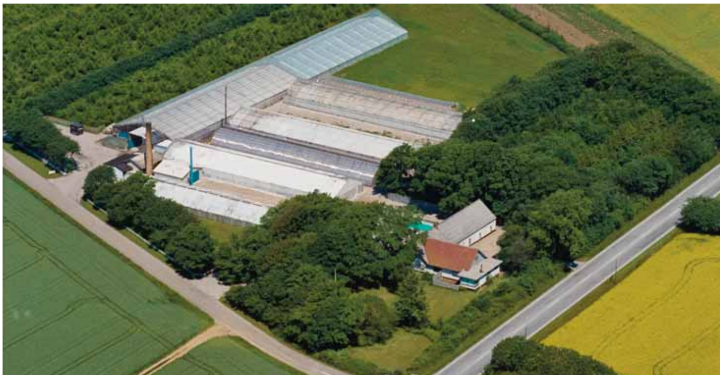
Gartneriet set fra luften i 1991.