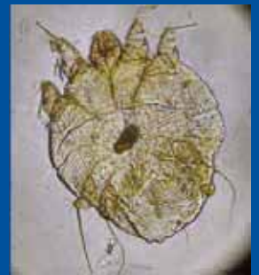
Fnatmide i mikroskop

Fnatmider – han og hun. Fra Salmonsens Konversationsleksikon. 2. udg. Bd. VIII. Kbh. 1919 s. 310.